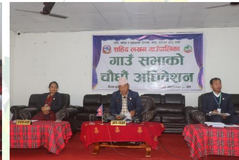
शहिद लखन गाउँपालिकाको गाउँ सभाको चौधौँ अधिवेशनको दोस्रो बैठक र आर्थिक वर्ष २०८०।०८१ को अर्ध वार्षिक समिक्षा कार्यक्रम ।