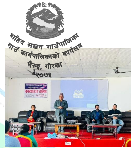
आधारभूत तहका शिक्षकहरूलाई एकिकृत पाठ्यक्रम (कक्षा १-३) सम्बन्धी कस्टमाइज्ड तालिम