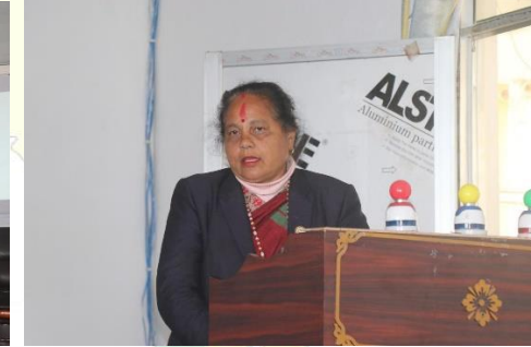
शहिद लखन गाउँपालिका भित्रका एकल महिलाहरूलाई वित्तीय सारक्षरता सम्बन्धी अभिमुखीकरण कार्यक्रम ।